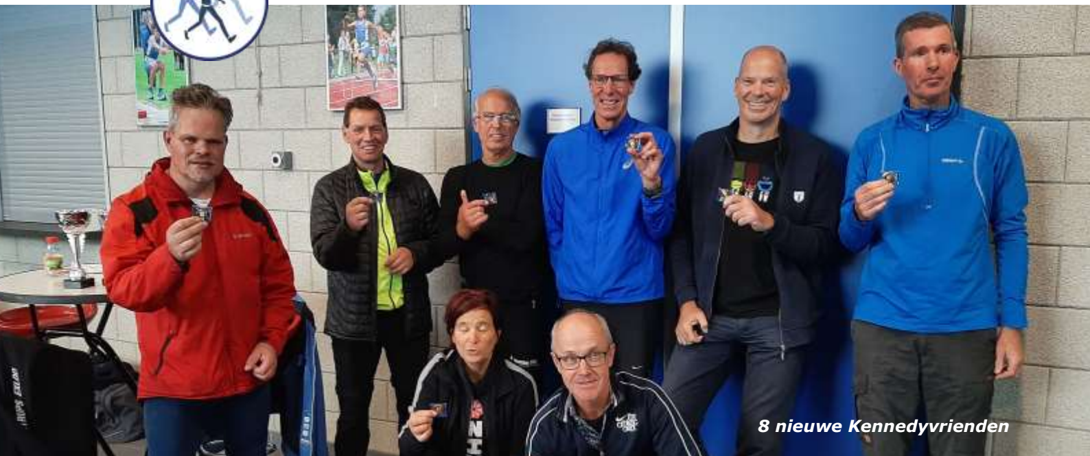
8 nieuwe Kennedyvrienden