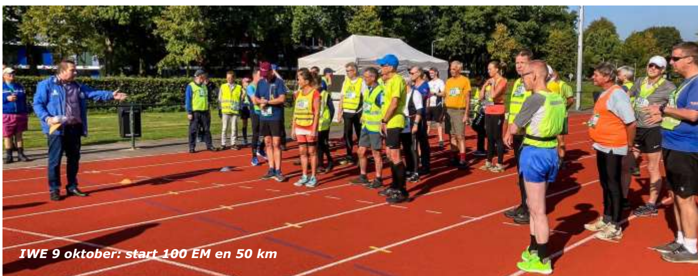
IWE 9 oktober: start 100 EM en 50 km

Op de website van OLAT staat een kalender die steeds aangepast wordt. Houd deze website in de gaten voor het laatste nieuws.